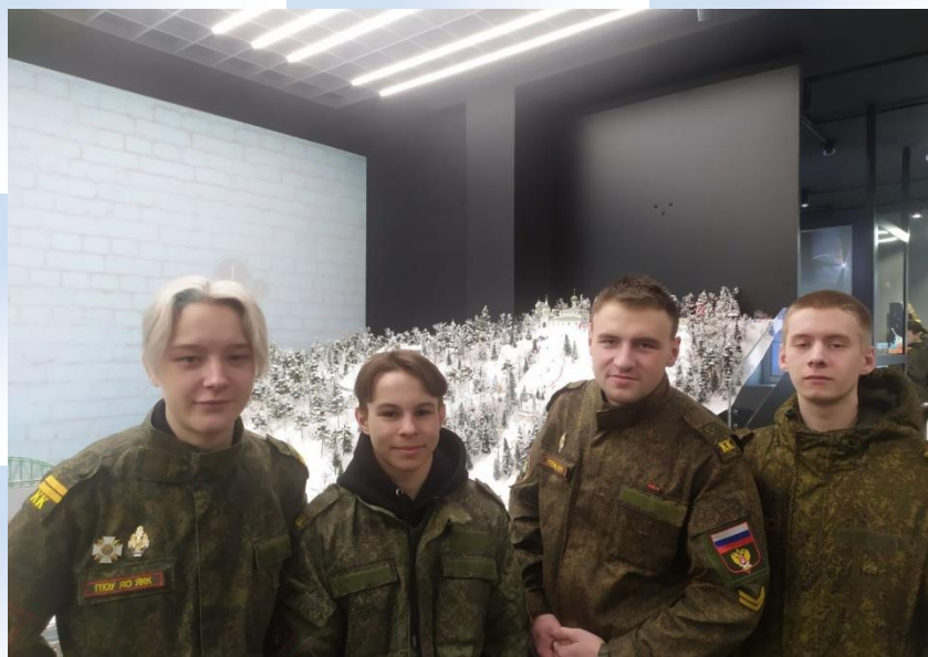
Шоу-макет «Золотое Кольцо»