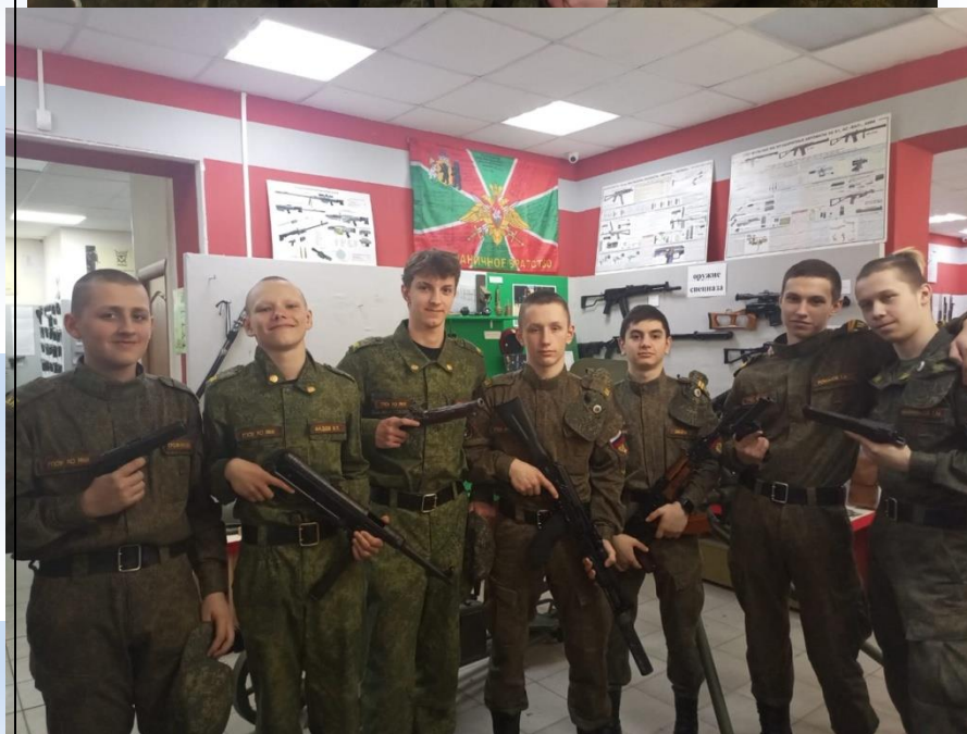
Музей стрелкового и холодного оружия